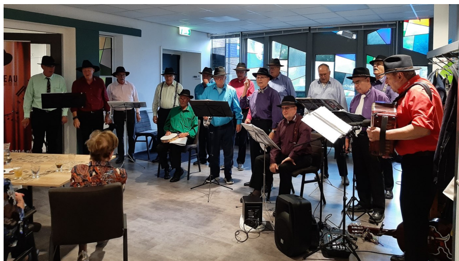
Optreden van het Oosterhoutse Mannen Ensemble 'Chapeau' in 2023

Op vrijdag 18 oktober organiseert de werkgroep Speciale activiteiten een gezellige middag voor onze alleenstaande leden van 80 jaar en ouder .