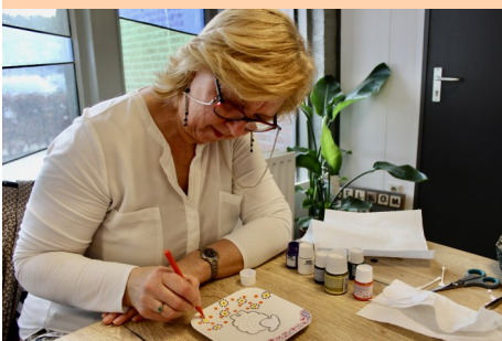
Een van de deelnemers tijdens de Paasworkshop porselein stippen, geconcentreerd aan het werk.