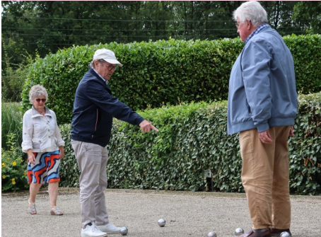
Bridgers aan het jeu de boulen