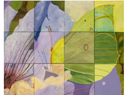
Foto van de schilderijtjes samen