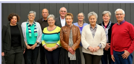
Onze Wmo-cliëntondersteuners (archieffoto 2022)